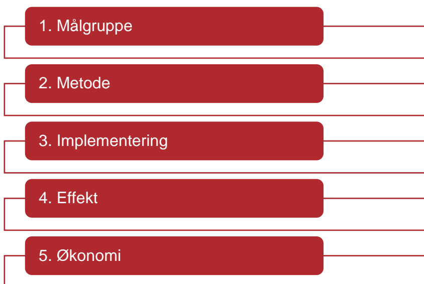
Figur 1: Videnstyperne i Vidensdeklarationen

I Vidensdeklarationen vurderes vidensgrundlaget inden for hver af de fem videnstyper på en skala fra A til D. A afspejler et solidt vidensgrundlag, som er direkte relevant for dansk kontekst, mens D afspejler ingen eller yderst ringe mængde beskrevet viden, der er relevant for dansk praksis.