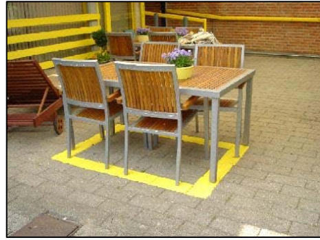
Tydelig visuel afmærkning (Æblehaven, Kolding)

Kendemærker: Da man som svagsynet eller blind nemt kan miste orienteringen, er det vigtigt at have kendemærker i det fysiske miljø. Kendemærkerne skal være konstante. Det vil sige, at det ikke må være ting, der flytter sig.