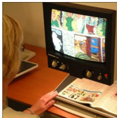
Et CCTV er et læseapparat, der kan forstørre en tekst eller andet op til 50 gange.

Synskonsulenten kan efter afprøvning af hjælpemidlet yde sagkyndig bistand, som kan danne grundlag for kommunal sagsbehandling og bevilling. Følgende vil ofte være aktuelt: filterbriller, lup med fast afstand, luplamper, skråplader, blindestok, cd- og båndafspillere, CCTV, hjælpepanel til telefon, specialtilrettede pc-løsninger samt talemaskiner, fx med taktile symboler. Synskonsulenten vil også kunne måle, om den eksisterende belysning er inden for de anbefalede normer, og eventuelt komme med forslag til lampe- og elpære typer, der giver bedre belysning.