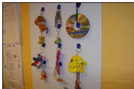
Taktilt symbol for hver medarbejder (Hindhøjen, Hinnerup)

Kontraster og farver: Gode kontraster fremmer mulighederne for at orientere sig. For eksempel kan dørkarm og dør have en anden farve eller markant anderledes farvetone end væggen. Hvis gulvet har forskellig farvetone fra væg, giver det bedre rumfornemmelse – det samme gælder loftet. Hjørner, der stikker ud i rummet kan males med en 8-12 cm bred kontrastfarve fra gulv til loft. På et hvidt badeværelse er mørkt håndklæde og farvet toiletsæde en god hjælp, ligesom kontrast omkring toiletrulleholder. Andre gode markeringer er kontrastafmærkning omkring hvide lyskontakter på hvid væg, kontrast på hyldekanten i skabe samt greb på skabe, døre og vandhaner i anden farve eller tone end omgivelserne.