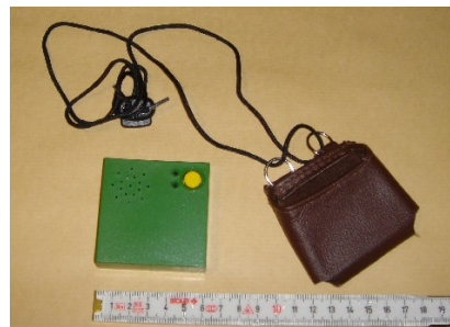
Eksempel på talende ur ( Easyvox)

Tv, telefoner og cd- eller båndafspillere: Billedet på fjernsynet vil virke større, jo tættere på fjernsynet man sidder. Man siger vejledende, at billedet bliver dobbelt så stort, hvis man halverer afstanden til fjernsynet. Husk dog på, at personer med nedsat synsfelt kan have brug for at sidde længere fra skærmen for at se et tilstrækkeligt stort udsnit af billedet. Telefoner kan fås med store taster eller med hjælpepanel. Der findes cd- og båndafspillere med enkel betjening, eventuelt med følbare (taktile) afmærkninger. Man kan også selv lave følbare afmærkninger på apparaterne, så de er hurtigere og enklere at betjene. (Spørg synskonsulenten, hvem der kan hjælpe med særligt indrettede telefoner, pc'er og cd-/båndafspillere m.v. i dit område)