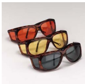
Filterbriller kan fjerne bestemte bølgelængder af lyset, som kan virke generende. På billedet vises briller fra Eschenbach.