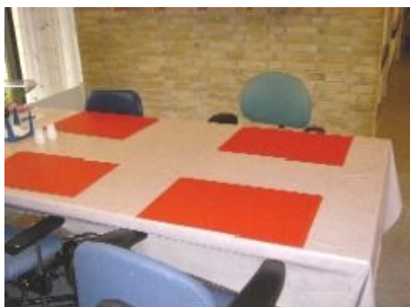
Mat skriveunderlag brugt som dækkeserviet (Trindvold, Børkop)

En dækkeserviet kan hjælpe med at afgrænse det område, hvor den svagsynede eller blinde skal søge efter mad og bestik, serviet m.m. Dækkeservietten bør være ensfarvet i en farve der giver kontrast til bord og service. (Se bilag 3).