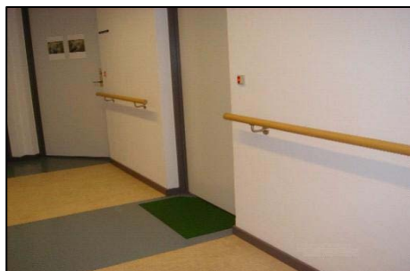
Ændret gulvbelægning ved døre (Hindhøjen, Hinnerup)