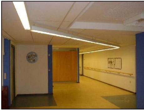
Lysledelinje i loftet (Hindhøjen, Hinnerup)