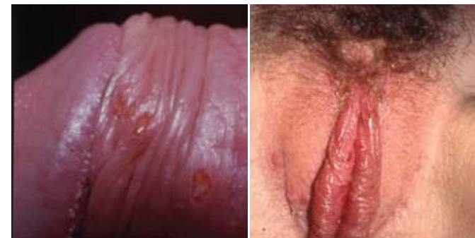
Herpes hos mand

Herpes på kønsdelene kan smitte ved dansk, fransk og græsk.