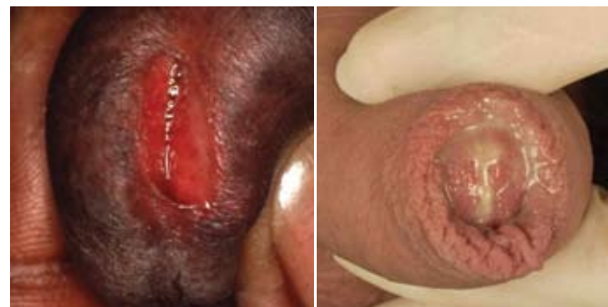
Klamydia hos mand