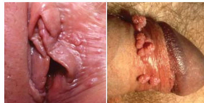
Kønsvorter hos kvinde

Der findes flere forskellige måder at behandle kønsvorter på.